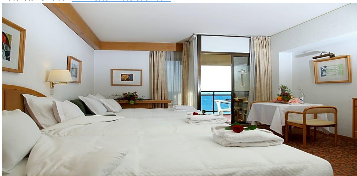
Ett standard dubbelrum på Estoril Eden Hotel

Hotellets hemsida: www.estorilhoteleden.com