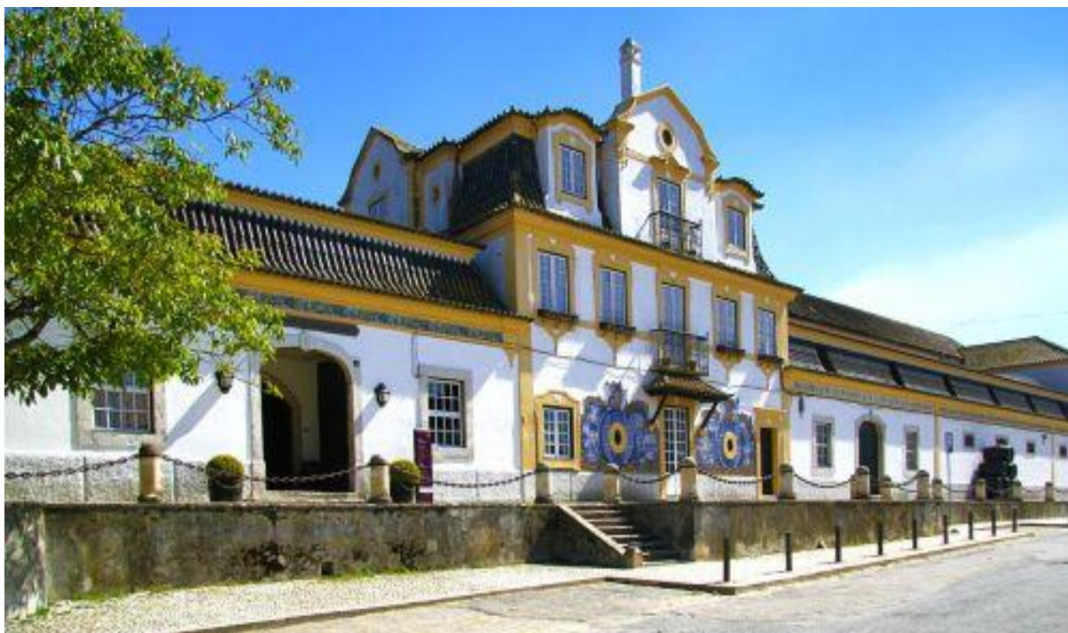
Den pampiga vingården Jose Maria da Fonseca