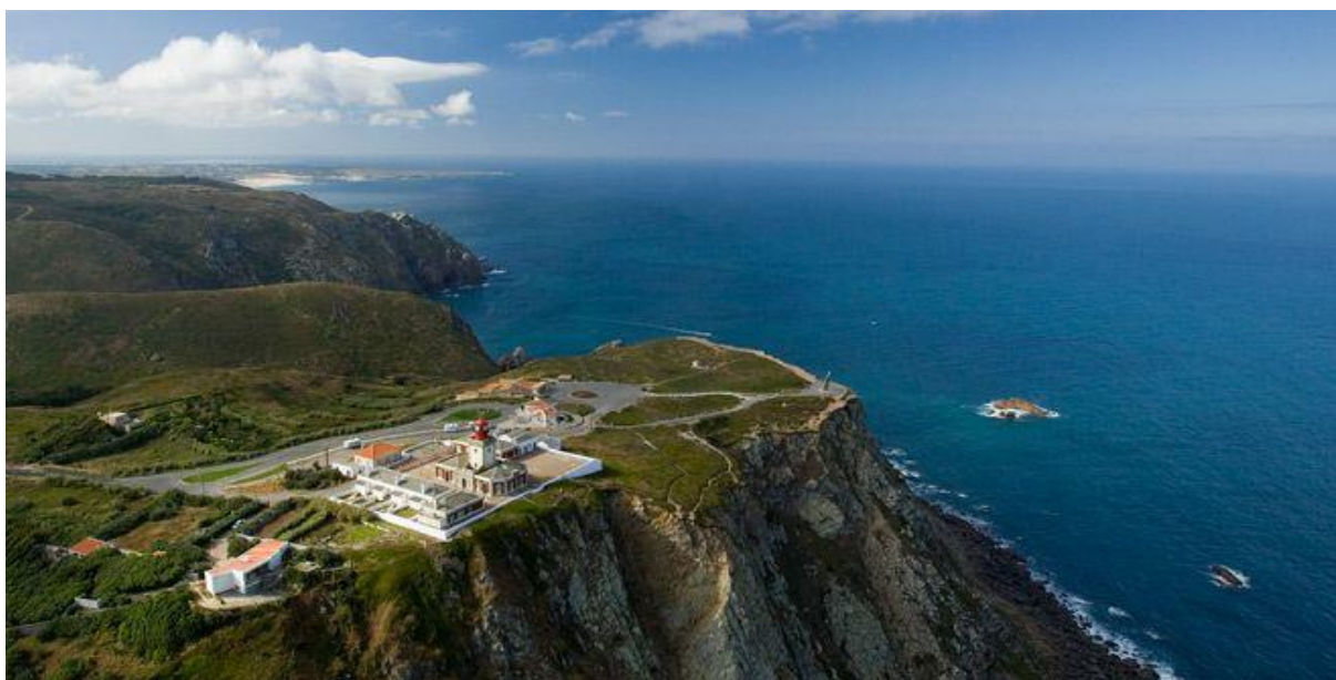
Cabo da Roca – det europeiska fastlandets västligaste punkt