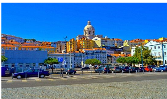
Alfama – Lissabon – där Fado-restaurangerna ligger tätt.