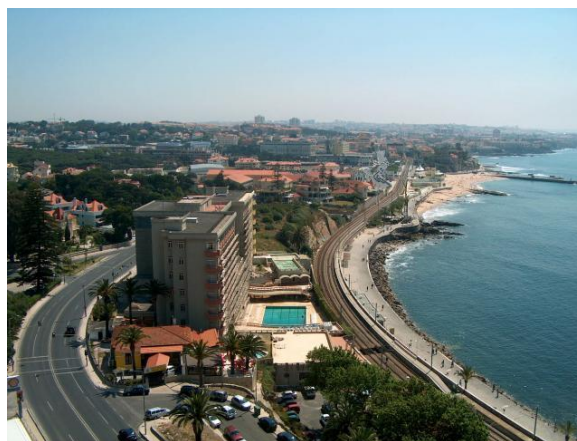
Vårt fina hotel Estoril Eden ligger med fantastisk utsikt över Cascaisbukten.