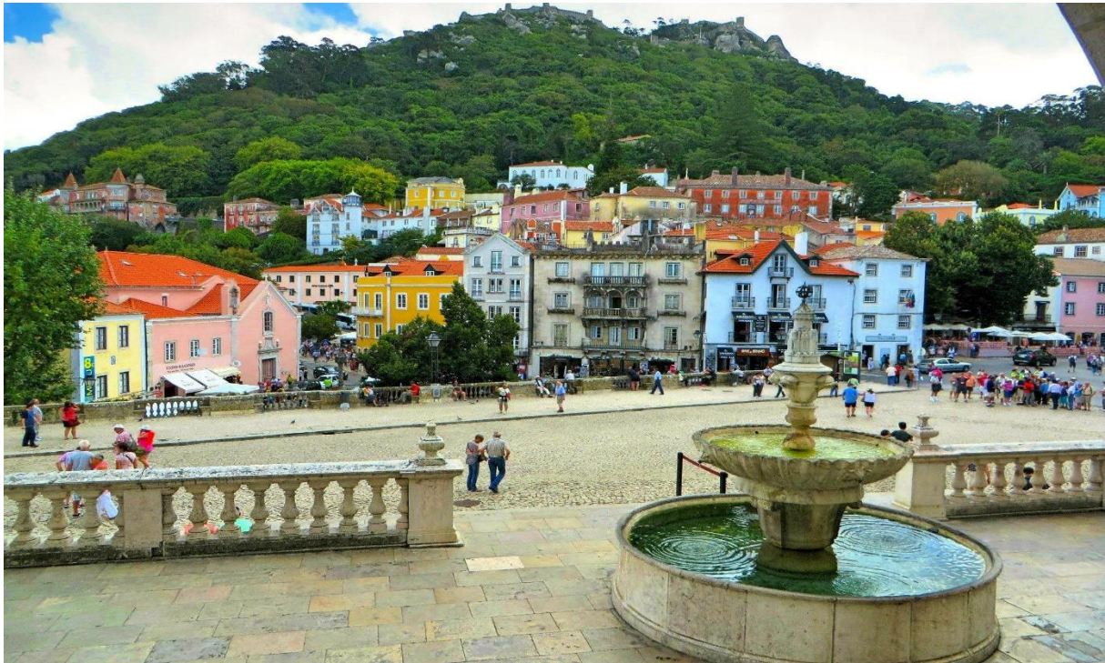
Sintras vackra centrum