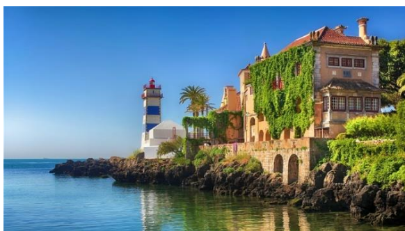
Cascais och Estoril